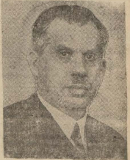
Ulusal Ekonomi ve Arttırma Kurumu Başkanı General Kâzım Özalp

Töreni Rektör Cemil Bilsel açacak ve Ulusal Ekonomi ve Arttırma Kurumu Başkanı General Kâzım Özalp duygularını söyleyecektir. Ayrıca üç profesörle talebe de söz alacaktır. Tören, Fakülte dekanının bir sövlevi ile kapanacaktır.